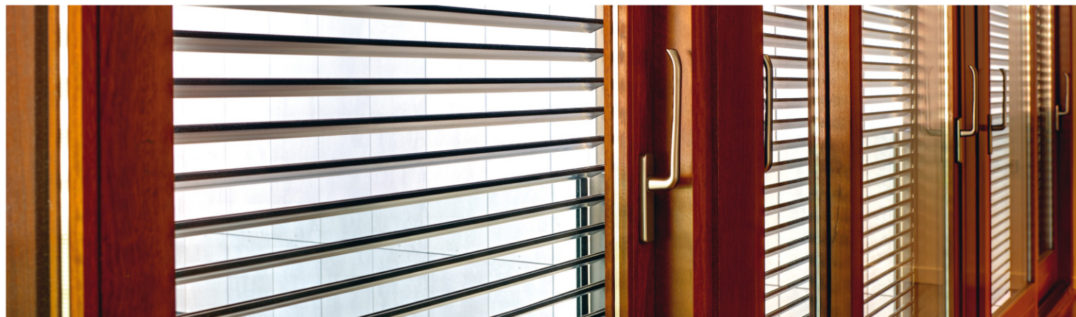
VENTANAS DE MADERA Y MIXTAS