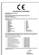
UNE-EN 14428:2016 Mamparas de baño